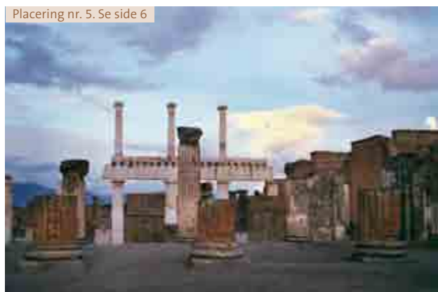
Placering nr. 5. Se side 6