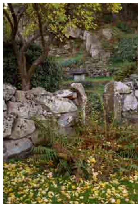
Placering nr. 12d. Se side 6