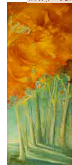
Placering nr. 7. Se side 6