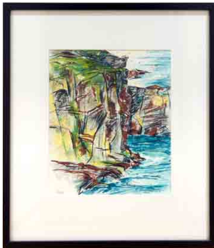
Placering nr. 14. Se side 6