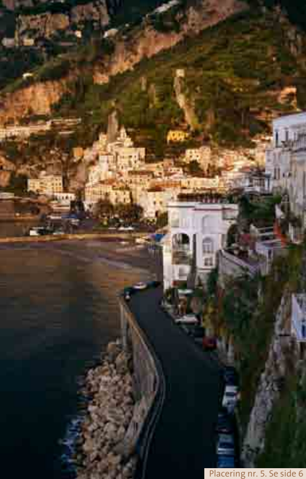
Placering nr. 5. Se side 6