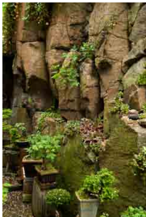
Placering nr. 11. Se side 6