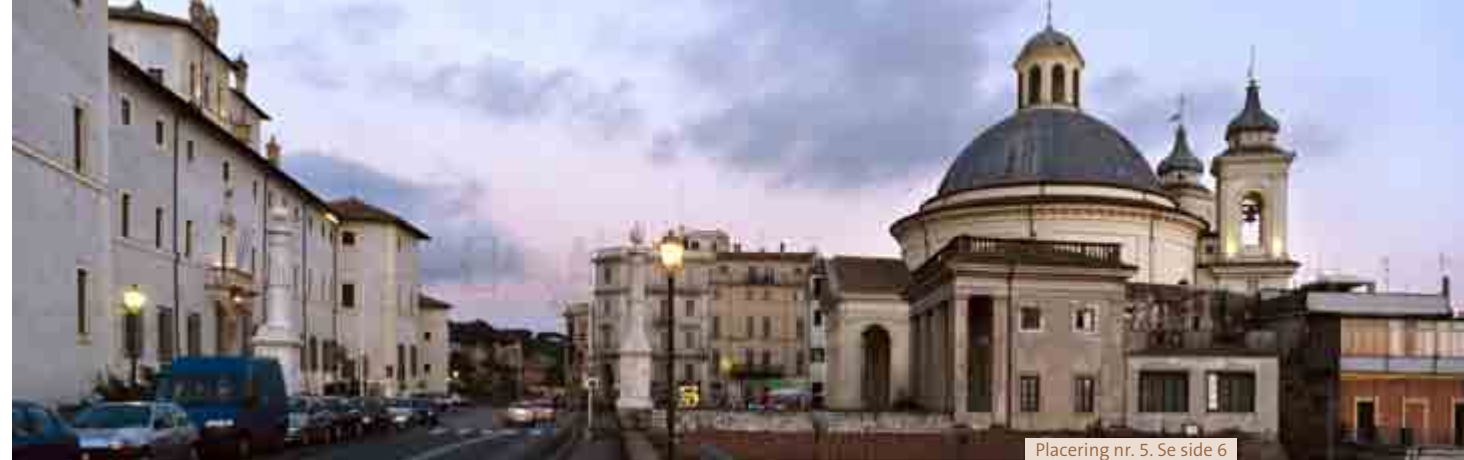
Placering nr. 5. Se side 6