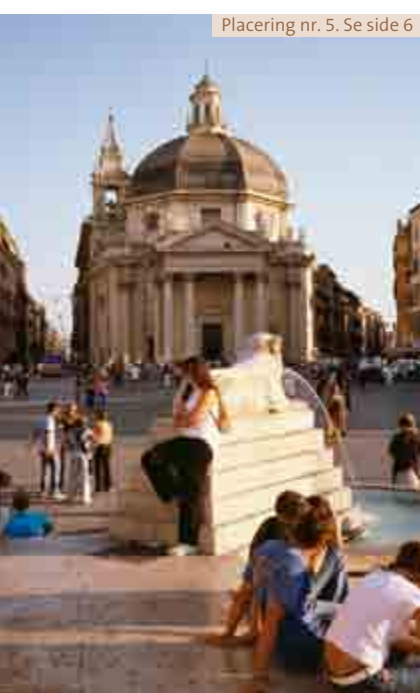
Placering nr. 5. Se side 6