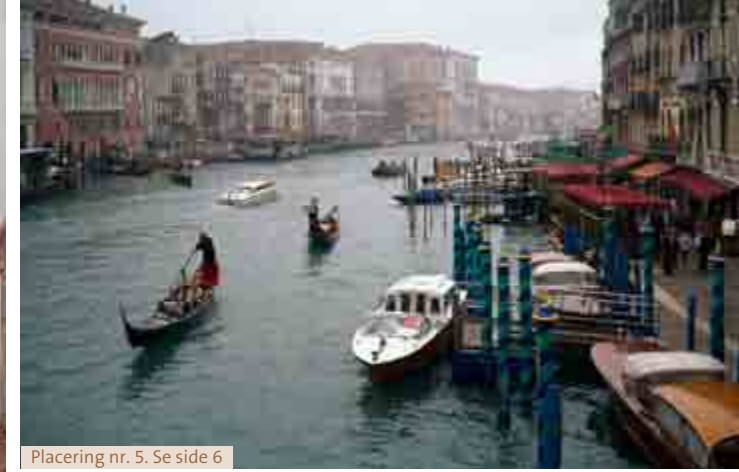
Placering nr. 5. Se side 6