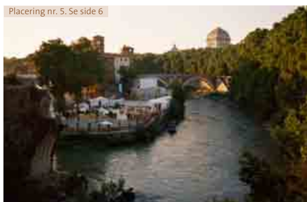
Placering nr. 5. Se side 6