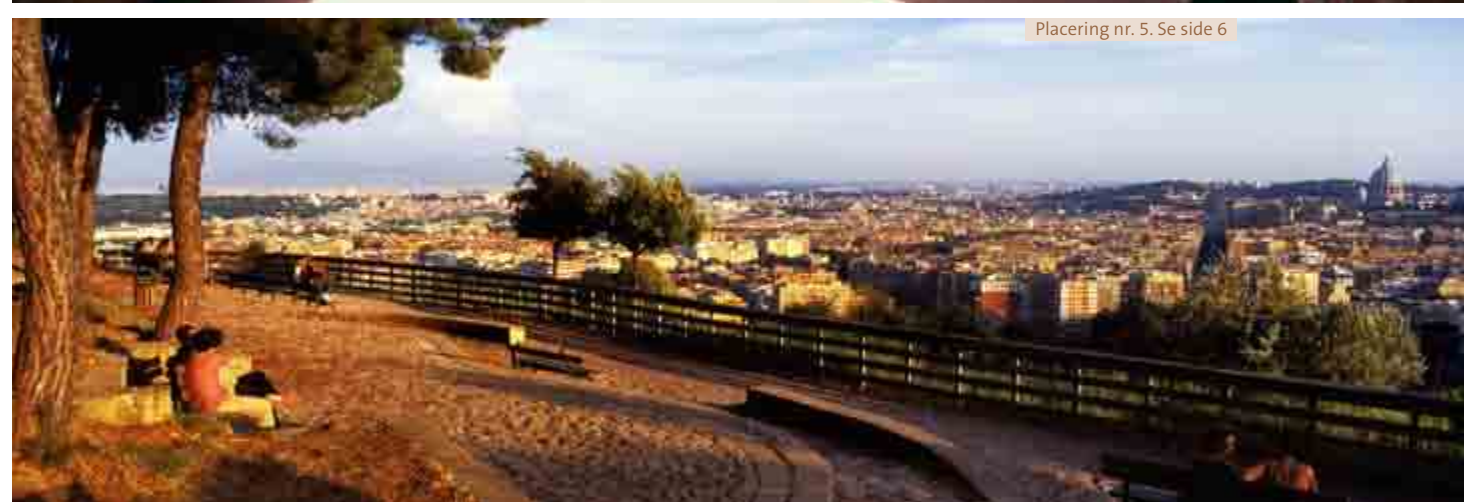
Placering nr. 5. Se side 6