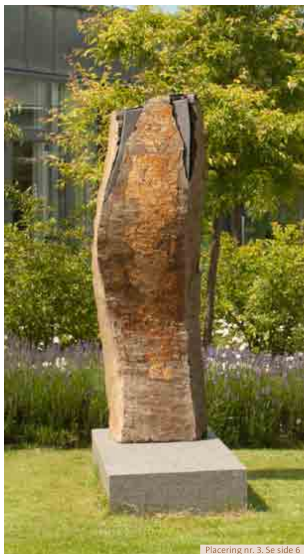
Placering nr. 3. Se side 6

Den anerkendte billedhugger Preben Boye er kunstneren bag den slanke stensøjle. Karakteristisk for Preben Boyes kunst er værket domineret af rene linjer og af overflader, der i forskellige struktur spiller mod hinanden. Han benyttede sig ofte af jetbrændte flader og polering i forskelligt omfang, hvor han formåede at frilægge og blankpolere små detaljer, så man kan have svært ved at tro, at det er den samme sten.