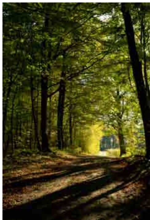
Placering nr. 10. Se side 6