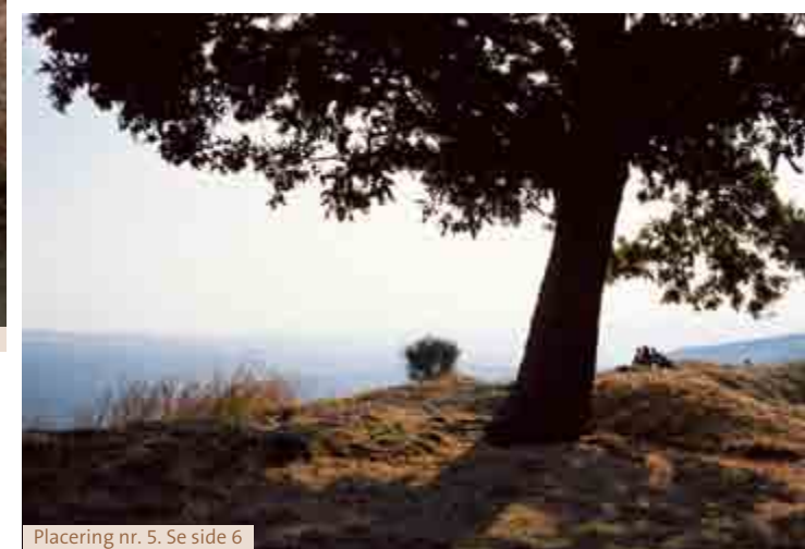
Placering nr. 5. Se side 6

Janne Klerk har fået tilbagemeldinger fra husets brugere om, at de på en trist dag bider mærke i de mørke skyer, og på en god dag hæfter sig ved lysningen.