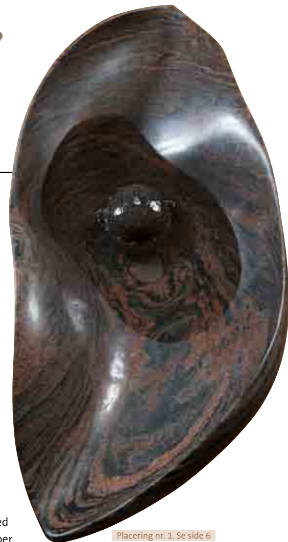
Placering nr. 1. Se side 6