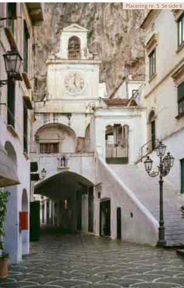
Placering nr. 5. Se side 6