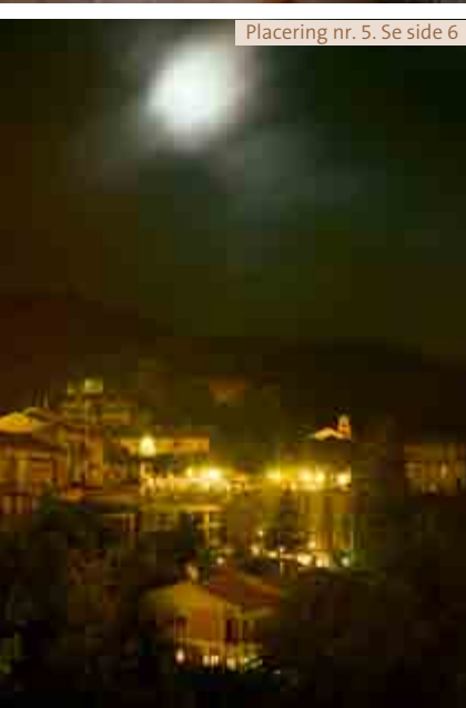
Placering nr. 5. Se side 6