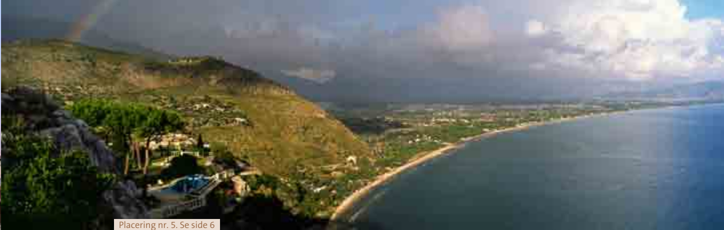
Placering nr. 5. Se side 6