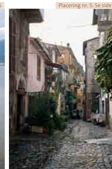
Placering nr. 5. Se side 6