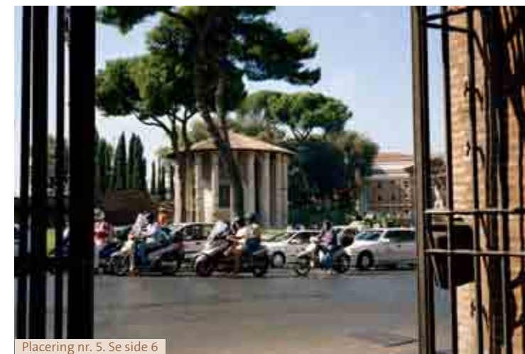
Placering nr. 5. Se side 6