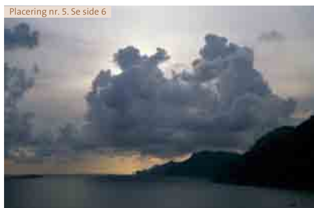
Placering nr. 5. Se side 6