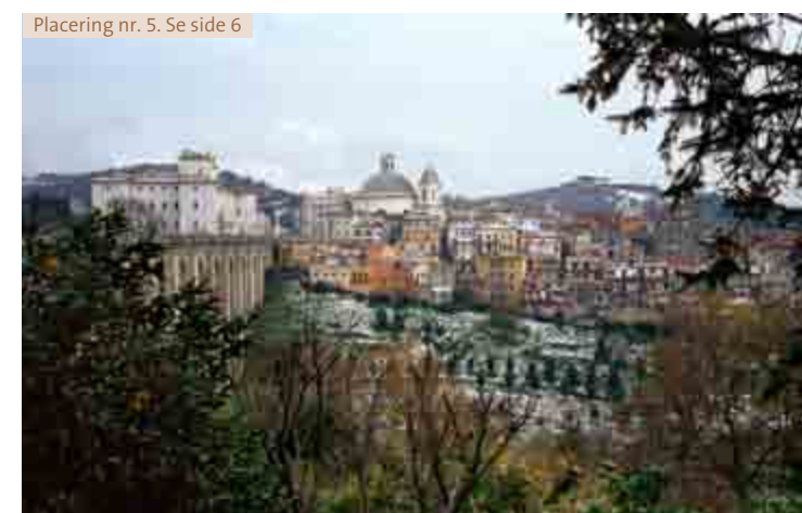
Placering nr. 5. Se side 6