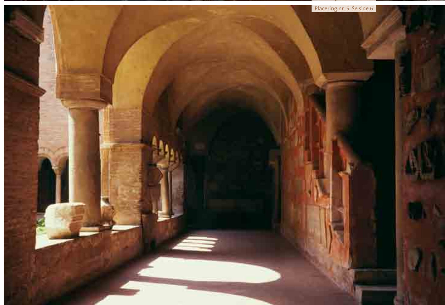
Placering nr. 5. Se side 6