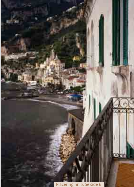
Placering nr. 5. Se side 6