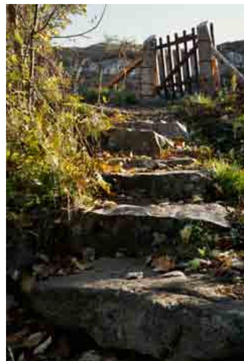
Placering nr. 12a. Se side 6