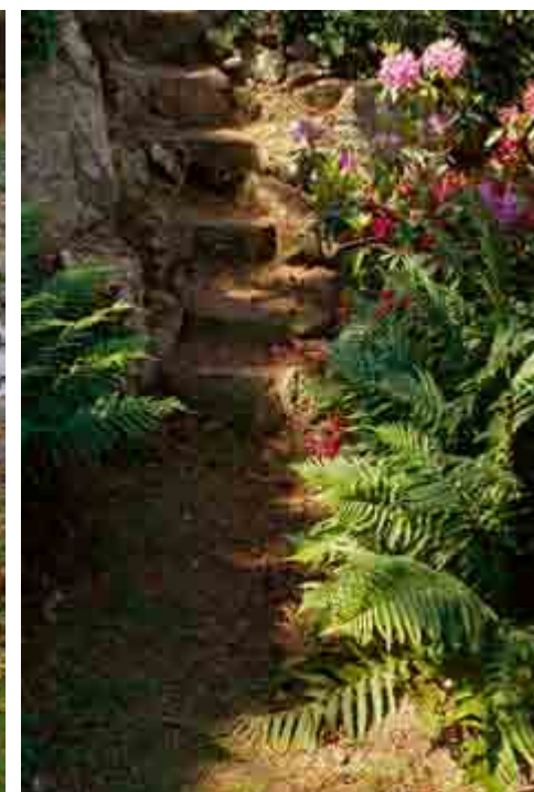
Placering nr. 12e. Se side 6