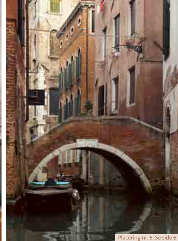
Placering nr. 5. Se side 6