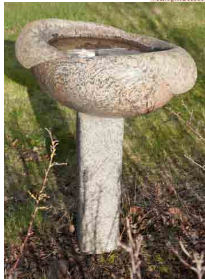
Placering nr. 2. Se side 6

Søren Schaarup (f. 1952) Født på Frederiksberg.