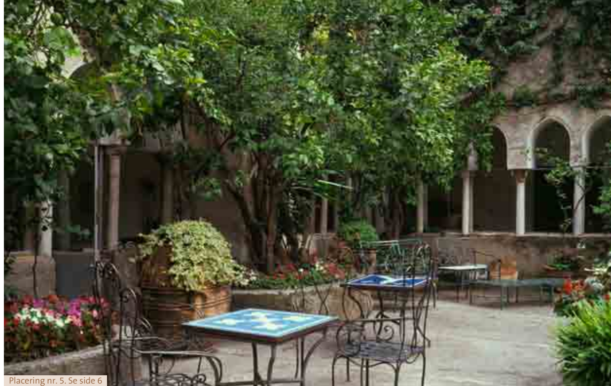
Placering nr. 5. Se side 6