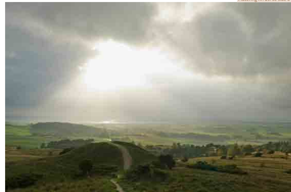
Mols Bjerge Af Janne Klerk.