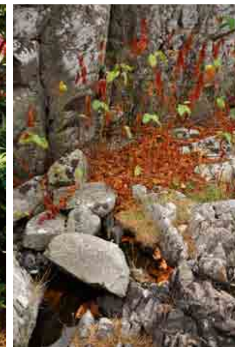
Placering nr. 12f. Se side 6