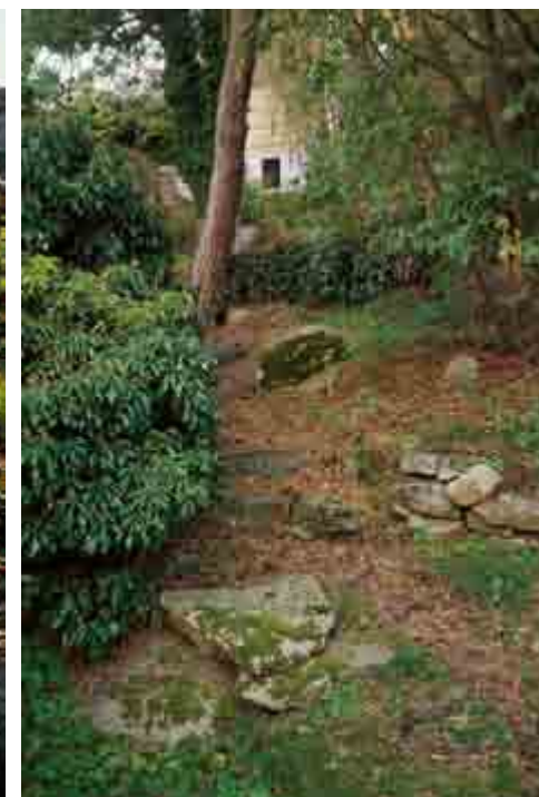
Placering nr. 12b. Se side 6