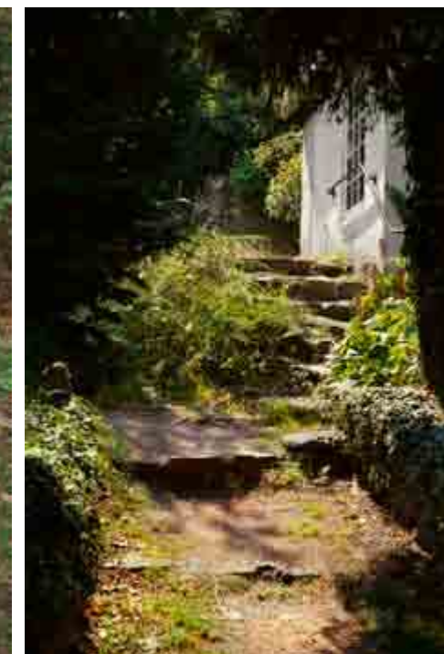
Placering nr. 12c. Se side 6