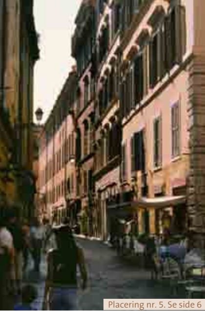
Placering nr. 5. Se side 6